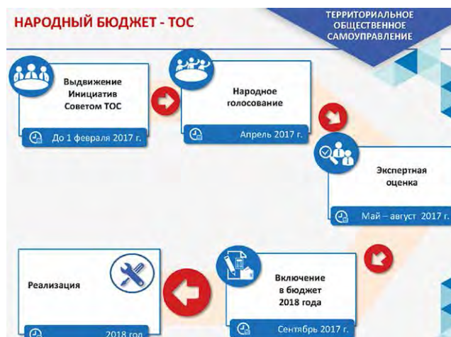
Схема реализации проекта «Народный бюджет-ТОС» в городе Череповце

В 2014–2015 годах окончательное решение принимала рабочая группа, оценивая проекты по заранее определенным критериям. С 2016 года решение о выборе проектов принимается в ходе «народного голосования», а рабочая группа их утверждает. Выбранные предложения включаются в муниципальные программы и получают финансирование из городского бюджета.