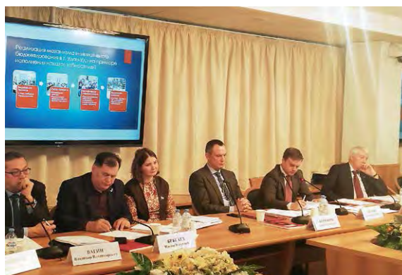
Обсуждение правовых основ инициативного бюджетирования

Проводимая по данному направлению работа получила высокую оценку международных экспертов на конференции «Участие граждан как ресурс развития: российский и международный опыт инициативного бюджетирования» в рамках Московского финансового форума 7 сентября 2018 года.