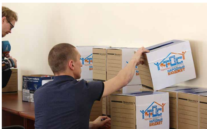
Подсчет голосов за инициативы ТОС в рамках проекта «Народный бюджет-ТОС»

За годы работы трансформировалась и концепция рабочей группы. В «Народном бюджете» в состав рабочей группы входили представители администрации, отраслевых подразделений, думы, крупнейших предприятий Череповца, а также инициаторы отобранных проектов. В рабочей группе «Народного бюджета-ТОС» представители бизнеса отсутствуют, а интересы горожан выражают представители органов ТОС (по согласованию).