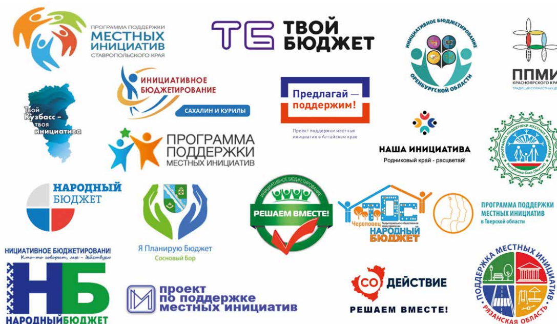
Логотипы практик инициативного бюджетирования

Ввиду необходимости широкого информирования граждан для обеспечения качественных процедур участия в составе госпрограмм в субъектах Российской Федерации отмечаются мероприятия информационных кампаний. В частности, важность информационной работы с населением отражена в госпрограммах Ставропольского и Алтайского краев, Ярославской, Ульяновской областей. Положительные результаты достигнуты в части разработки брендинга, айдентики региональных практик, которые становятся более узнаваемыми параллельно с официальным названием, включенным в нормативно-правовые акты, появляются легко запоминающиеся названия для распространения в средствах массовой информации, например, «Твой бюджет» (Санкт-Петербург), «Решаем вместе!» (Ярославская область), «Алтай предлагай» (Алтайский край), «Берег Енисея» (Красноярский край), «Твой Кузбасс – твоя инициатива» (Кемеровская область), «СОдействие» (Самарская область), «Забайкалье – территория будущего» (Забайкальский край).