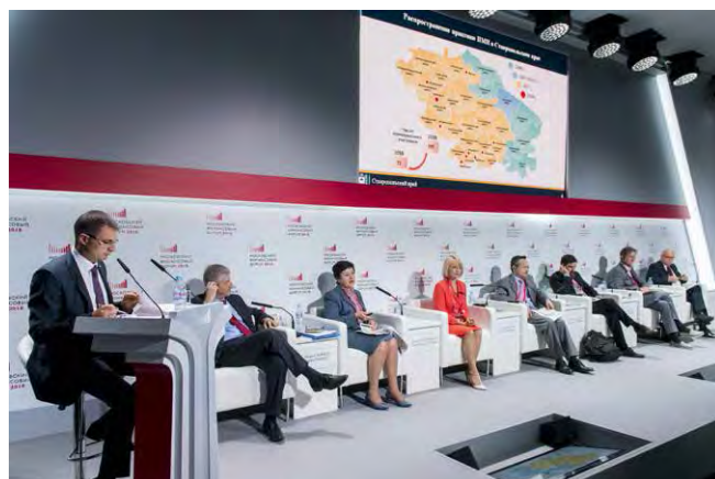
Конференция «Участие граждан как ресурс развития: российский и международный опыт инициативного бюджетирования»

Проводимая по данному направлению работа получила высокую оценку международных экспертов на конференции «Участие граждан как ресурс развития: российский и международный опыт инициативного бюджетирования» в рамках Московского финансового форума 7 сентября 2018 года.