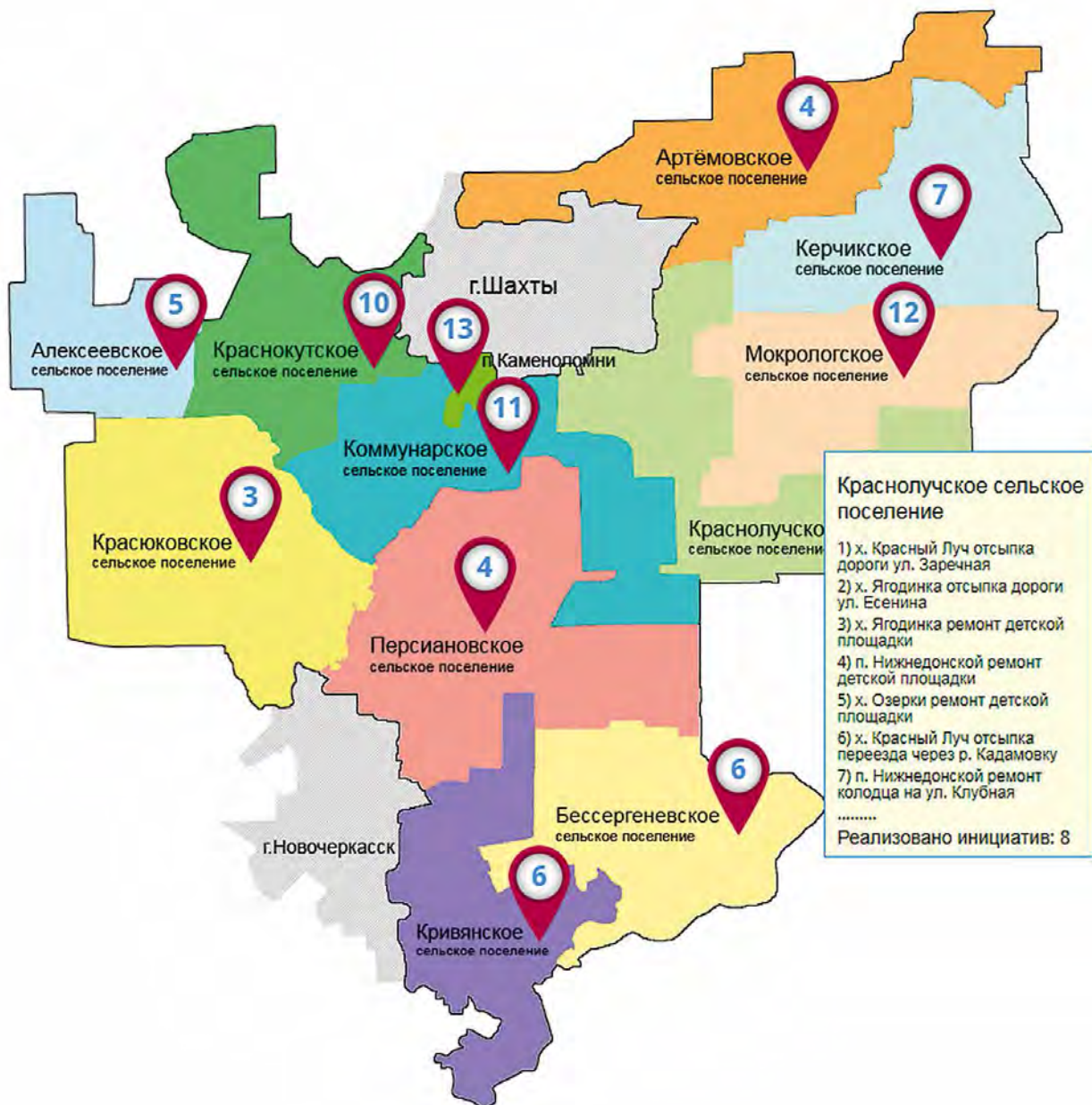
Карта инициатив Октябрьского района в 2018 году

казачьего пункта. Диапазон стоимости проектов также различается — от относительно недорогих проектов ограждения детских площадок и ремонта колодцев до финансово-емких проектов по ремонту моста и приобретения водонапорной башни, газификации.