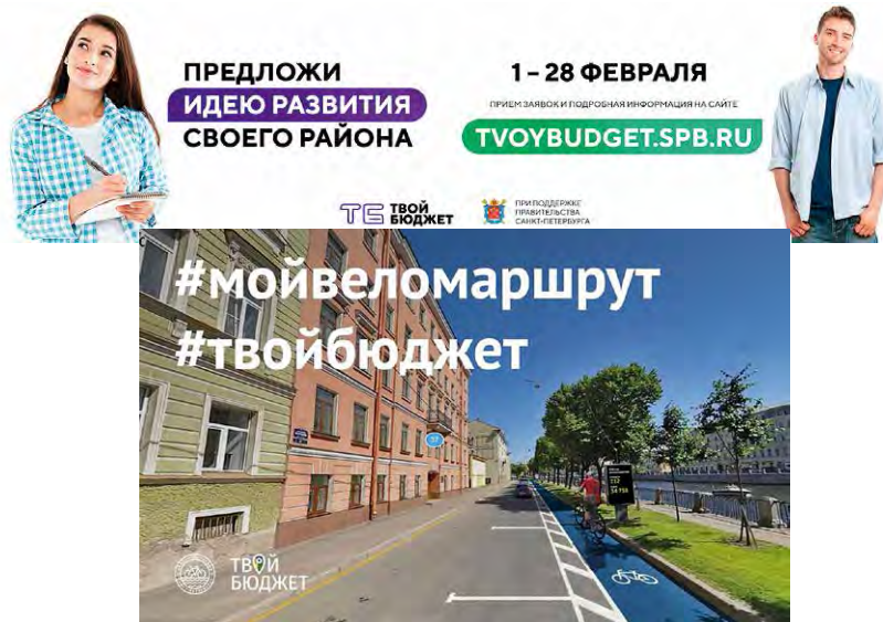
Рекламные и информационные материалы

группах практики «Твой Бюджет» в социальных сетях Вконтакте и Facebook, на канале в Youtube. За счет этого существенно увеличивается их аудитория, и другие жители города также получают возможность узнать, как и почему принимаются те или иные решения, получают базовые знания по бюджетному процессу, финансам, урбанистике и государственным закупкам.