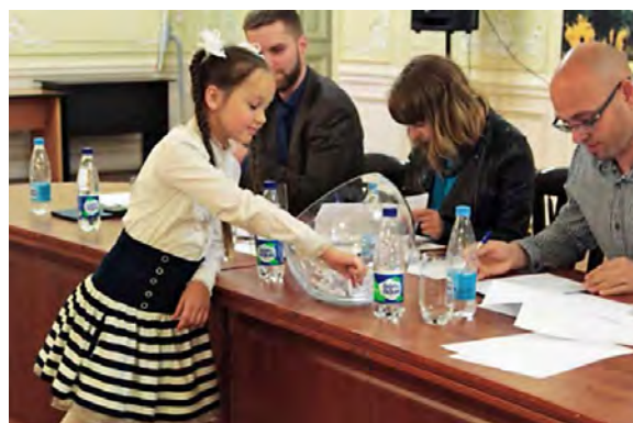
Жеребьевка членов бюджетной комиссии

Ход обсуждения и отбора проектов бюджетными комиссиями, а также их последующей реализации также освещается городскими СМИ. Таким образом, в Санкт-Петербурге выстроена системная информационная кампания практики инициативного бюджетирования «Твой бюджет».