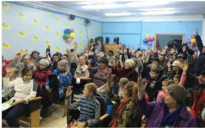
Сход жителей Рощинского сельского поселения

тий проекта «Формирование комфортной городской среды». Одновременно в области был реализован приоритетный региональный проект поддержки местных инициатив (ППМИ).