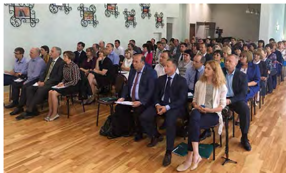
Участники информационно-обучающих мероприятий практикам инициативного бюджетирования

В 2018 году Минфином России проведены разработка и обсуждение, в том числе в Совете Федерации и Государственной Думе с участием представителей финансовых органов субъектов Российской Федерации, законопроектов о внесении изменений в Федеральный закон от 6 октября 2003 года № 131-ФЗ «Об общих принципах организации местного самоуправления в Российской Федерации» и в Бюджетный кодекс Российской Федерации в связи с определением правовых основ инициативного бюджетирования. Внесение указанных законопроектов в Правительство Российской Федерации произошло в 2019 году.