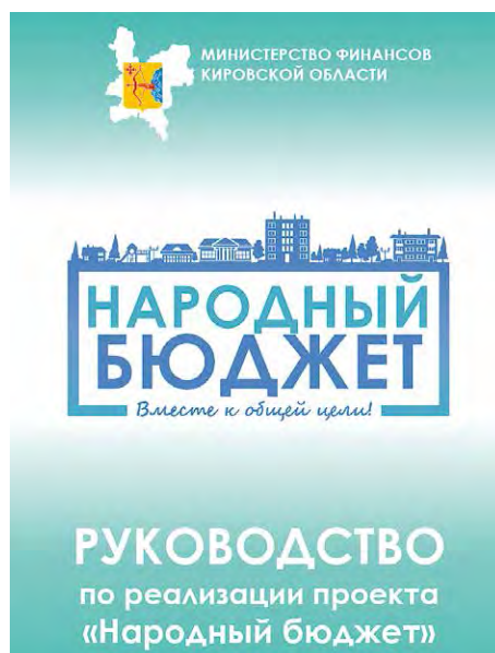
Руководство по реализации проекта «Народный бюджет»

Для участников проекта подготовлено Руководство по реализации проекта «Народный бюджет». В руководстве подробно указаны все этапы действий администрации муниципального образования, модератора и членов бюджетной комиссии. Также для городских поселений подготовлено типовое Положение о проекте.