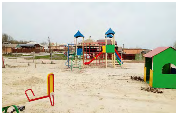
Примеры реализованных проектов в Октябрьском районе Ростовской области