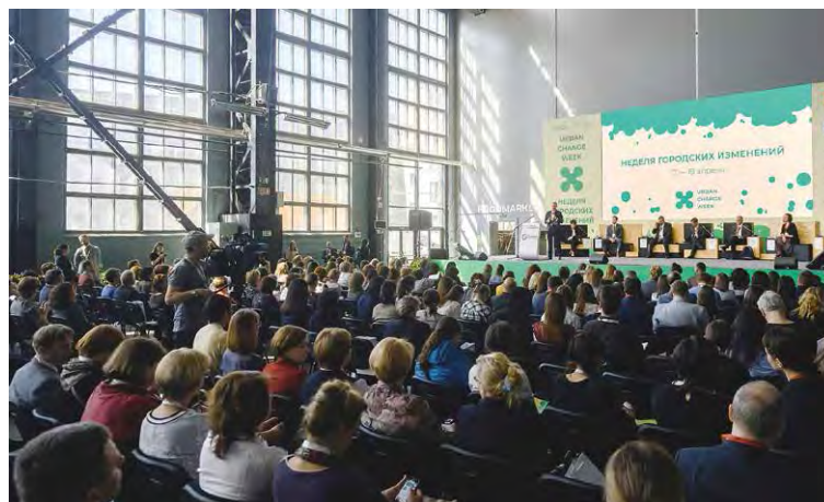
Форум общественного участия, посвященный вопросам инициативного бюджетирования, Санкт-Петербург

Обсуждение уникальности российской практики развития инициативного бюджетирования с международными экспертами из Испании, Португалии, Бразилии, США, Италии, Исландии, Южной Кореи и Китая продолжилось в рамках состоявшегося при поддержке Минфина России и Всемирного банка 18–19 апреля 2019 года в Санкт-Петербурге международного форума «Общественное участие в развитии мегаполисов: расширение возможностей» (Public Participatory Forum). Отличительной особенностью российской практики является поддержка и координация на федеральном уровне совместных усилий экспертного сообщества, органов государственной власти и местного самоуправления, граждан и представителей бизнеса в содействии внедрению инициативного бюджетирования.