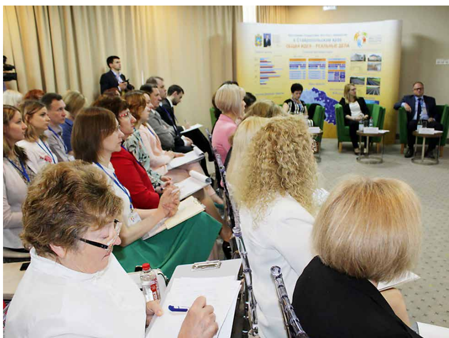
Семинар «Информационное сопровождение в проектах инициативного (партисипаторного) бюджетирования» (г. Кисловодск, 2018 г.)

По инициативе Министерства финансов Ставропольского края в 2016 году в Пятигорске состоялся первый всероссийский семинар-совещание по теме «Информационные кампании инициативного бюджетирования в субъектах Российской Федерации». Семинар открыл для российской аудитории одно из направлений деятельности в реализации программы ИБ, предполагающее планирование информационных мероприятий по вовлечению граждан в инициирование, обсуждение и выбор проектов ИБ, запустил обсуждение инструментария и методов ведения информационных кампаний местного, регионального и федерального уровней. В 2017 году в Ставропольском крае, в целях расширения охвата Проекта местных инициатив на весь регион разработали и запустили краевую информационную кампанию, опыт проведения которой был от-