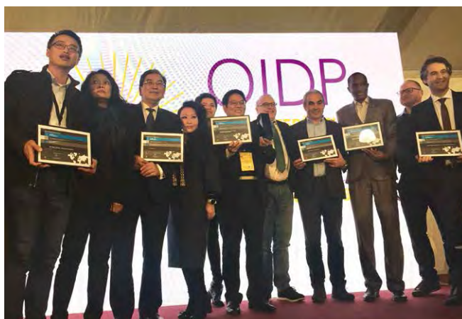
Представители Республики Саха (Якутия) на церемонии награждения конкурса «International Observatory on Participatory Democracy» (IOPD)

Обсуждение уникальности российской практики развития инициативного бюджетирования с международными экспертами из Испании, Португалии, Бразилии, США, Италии, Исландии, Южной Кореи и Китая продолжилось в рамках состоявшегося при поддержке Минфина России и Всемирного банка 18–19 апреля 2019 года в Санкт-Петербурге международного форума «Общественное участие в развитии мегаполисов: расширение возможностей» (Public Participatory Forum). Отличительной особенностью российской практики является поддержка и координация на федеральном уровне совместных усилий экспертного сообщества, органов государственной власти и местного самоуправления, граждан и представителей бизнеса в содействии внедрению инициативного бюджетирования.