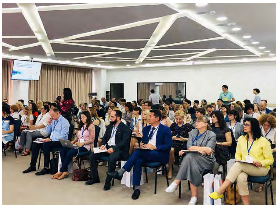
IV международный семинар-совещание «Вовлечение граждан в проекты инициативного бюджетирования» (г. Железноводск, 2019 г.)

С каждым годом дискуссионная площадка Ставропольского края привлекает все большее число финансистов и практиков в вопросах инициативного бюджетирования со всей России. За четыре года аудитория семинара увеличилась в три раза, в первом семинаре участвовали 43 человека, в 2019 году – уже более 100. Количество регионов выросло почти в два раза – с 20 до 38. Всего около 300 представителей органов государственной власти, муниципалитетов, консультантов, экспертов стали участника-