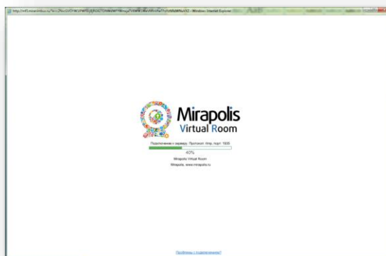
Рис. 3 Загрузка «виртуальной комнаты»

После нажатия на ссылку начнется загрузка виртуальной комнаты (Рис. 3).